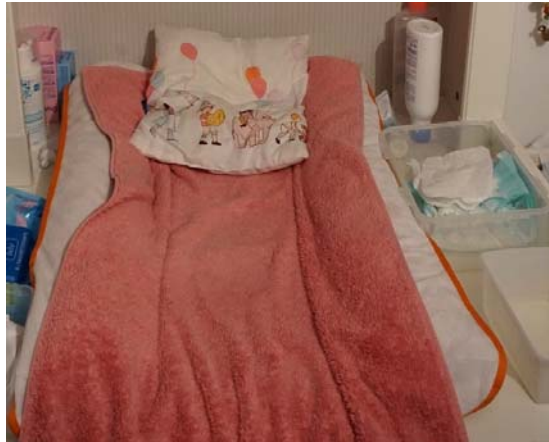
E6 : Contenant spécifique pour les couches, vidé très régulièrement afin d'éviter la production de mauvaises odeurs.

Lui : « alors que moi je les descends systématiquement une fois que je l'ai changée. Le pipi ça va dans la poubelle de la cuisine et le caca je mets ça dans un sac sur le perron puis ça va dans la grande poubelle ensuite. » (E21)