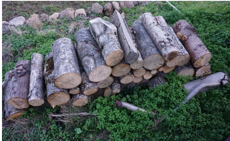
E3 : Disparition progressive d'un pot d'échappement sous la végétation