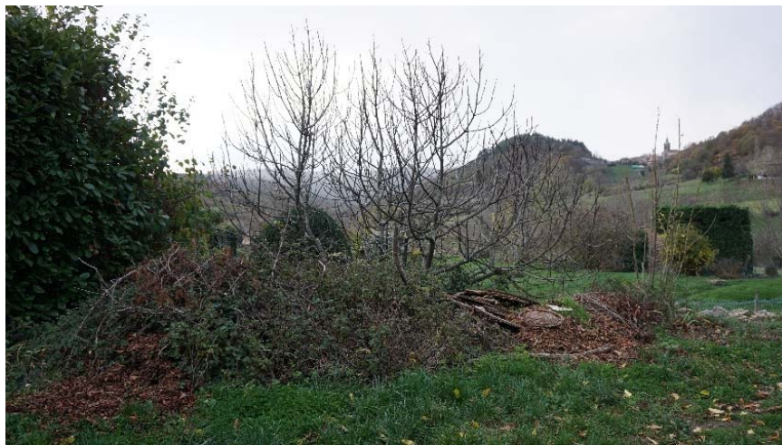
E16 : disparition progressive du tas de gravats sous la végétation

L'absence d'un moyen de transport adapté est une donnée importante. Globalement, l'évacuation de tous les déchets difficiles à déplacer, parce qu'ils risquent de salir ou de blesser (verre cassé), sont évacués moins rapidement que les autres.