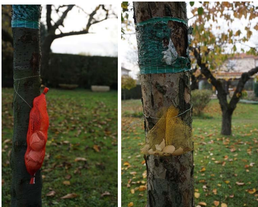
E1 Réutilisation des coquilles d'œufs pour faire fuir escargots et limaces

Ainsi, les coquilles d'œufs peuvent être utilisées dans le potager contre les escargots et les limaces ou sur les arbres contre les insectes (photos ci-dessous) :