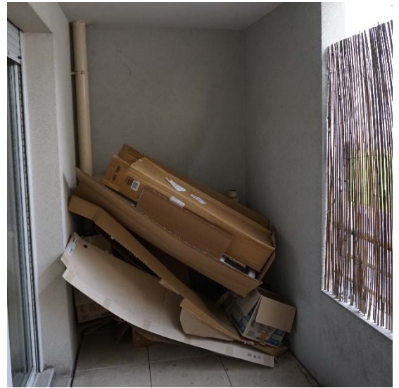
E7 : Cartons à jeter sur la terrasse depuis 1 an

Le stockage de moyenne ou de longue durée s'explique par le mode d'évacuation utilisé par les ménages. Ainsi, certains ménages, qui déploient une logistique de massification des déchets avant leur évacuation, vont stocker un certain nombre de déchets jusqu'à ce qu'ils considèrent que leur volume justifie un déplacement . L'inertie de ces déchets s'explique donc par une volonté d'optimiser le trajet jusqu'au point de collecte approprié . Selon la même logique, certains objets sont mis de côté parce qu'un déménagement est programmé et que les moyens mobilisés à cette occasion pourront être utilisés pour déposer ces déchets en attente. D'autres les stockent en attendant l'occasion de pouvoir les évacuer. Il s'agit d'une logique concernant par exemple ceux qui déposent une partie de leurs objets en déchèterie mobile, dans les grandes agglomérations où ce service est proposé. Le stockage est prolongé si le ménage est absent lors du passage de la déchèterie mobile.