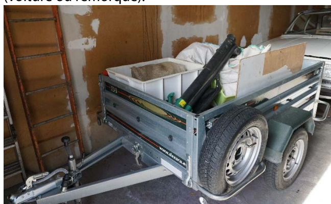
E4 : Objets à transporter jusqu'à la déchèterie et stockés dans le garage, directement dans la remorque

Les lieux de stockage intermédiaires peuvent aussi prendre la forme de dispositifs ambulants. Leur fonction peut être celle de limiter le dépôt inapproprié de déchets dans l'espace public (cendrier portatif par exemple) ou bien le stockage, directement dans le moyen de locomotion, d'objets à évacuer (voiture ou remorque).