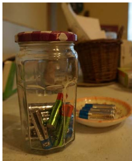
E15 : Piles stockées dans la cuisine de façon visible

Ces petits déchets sont mis à l'écart car ils sont produits à un rythme relativement lent et que leur évacuation demande une organisation particulière (lieux de dépôt dédiés et parfois mal identifiés). Ils