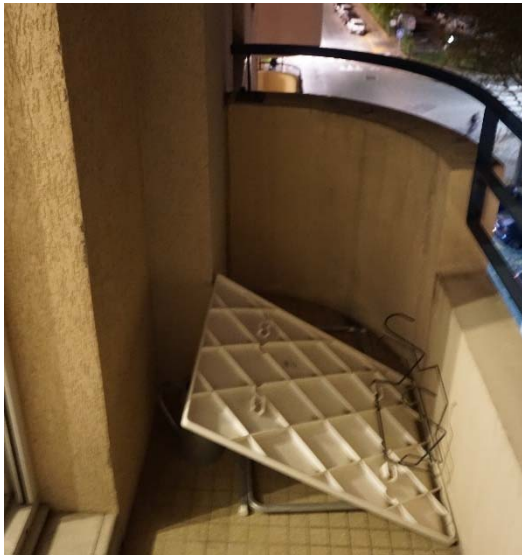
E6 : Table à jeter, placée sur le balcon depuis 3 ans