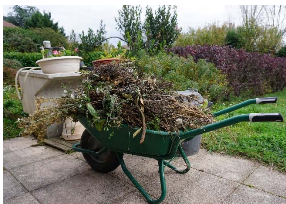
E8 : Déchets verts à emporter à la déchèterie stockés dans la brouette (jardin)

Les déchets entreposés dans la voiture pour être déposés dans un container ou à la déchèterie n'ont pas vocation à y être stockés. Mais, leur inertie peut être due à un oubli (dans le coffre) ou au fait que leur propriétaire ne les déplace pas, jusqu'au lieu de dépôt « final » . Ils restent donc dans la voiture et y sont stockés à plus ou moins long terme jusqu'à ce que leur propriétaire se décide à les déposer ou les « redécouvre » après les avoir oublié.