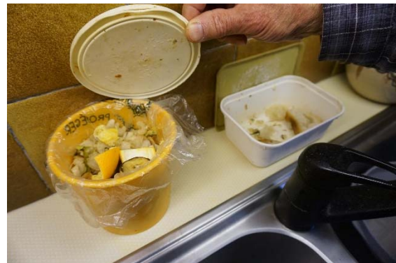
E1 le petit conteneur à déchets organiques, placé près de l'évier

Lorsque ces contenants spécifiques sont situés dans la cuisine, leur nombre dépend à la fois de la taille de la cuisine, de son agencement (emplacements spécifiques ou non) et du profil du jeteur (trieur ou non). Au sein de notre échantillon, le nombre de contenants dédiés au tri sélectif pratiqué dans la cuisine varie de 1 à 6.