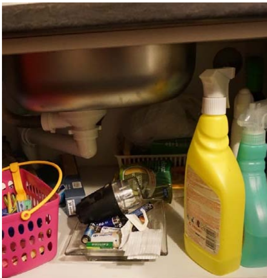
E9 : Coupelles placées sous l'évier servant à stocker piles et ampoules

Certaines catégories de déchets sont stockées dans des lieux intermédiaires dans une double logique de mise à l'écart et de mise en visibilité , notamment du fait de leur composition particulière, associée à une forme de danger . Il s'agit des pires, des ampoules, ou encore du verre cassé . Ils sont disposés dans de petits contenants (une « coupelle sous l'évier », un « vieux truc en terre cuite », dans « plusieurs petites boîtes un peu partout, c'est le bordel ») ou bien « laissés en vue » sur la desserte de la cuisine, « dans un cendrier dehors pour y penser ».