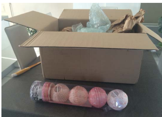
E13 : réception d'un colis que l'interviewé considère comme sur-emballé.

Les attentes formulées par les interviewés pour aller vers une réduction de la production de déchets concernent principalement la diminution des emballages au moment de la production. Dans leur discours, cette tendance nécessite une implication des politiques à ce sujet, jusqu'à la taxation ou l'interdiction de certains emballages.