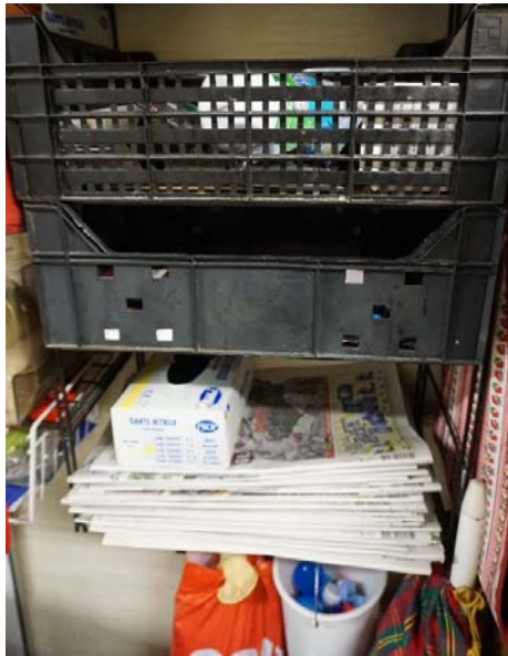
E1 : Contenants spécifiques dédiés aux déchets recyclables dans le garage, près de la porte de la cuisine.

De petits containers sont parfois disposés près de l'évier pour recueillir les déchets produits au moment de la préparation du repas. Ils permettent de trier les déchets organiques (ceux qui sont donnés aux animaux ou ceux qui alimentent le compost) ou plus simplement de limiter le nombre d'ouvertures et de fermeture de la poubelle du « tout-venant » pour ceux qui ne trient pas les déchets organiques :