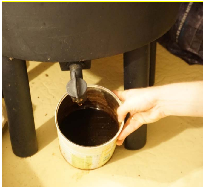
E2 : Lombricomposteur placé dans la loggia de l'appartement / Engrais recueilli sous forme liquide

Une partie des ménages pratiquant le compostage veille ainsi à cacher le bac dédié à cette activité.