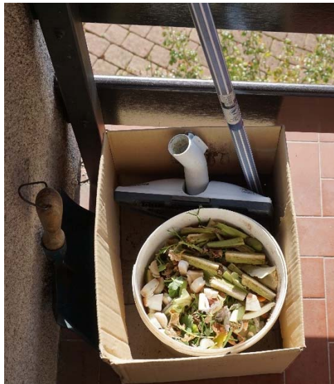
E4 : Stockage intermédiaires de déchets putrescibles sur le balcon

Tout d'abord, la mise en place de dispositifs intermédiaires de stockage permet de limiter les déplacements liés à la gestion quotidienne des déchets . Ainsi, des déchets tels que les objets recyclables sont stockés sur le balcon, dans un cellier, un cagibi ou un placard. Ils sont ensuite transférés, en général lorsque la capacité maximale de stockage est atteinte, vers le lieu de stockage final avant l'évacuation (garage, grande poubelle, etc). De la même manière,