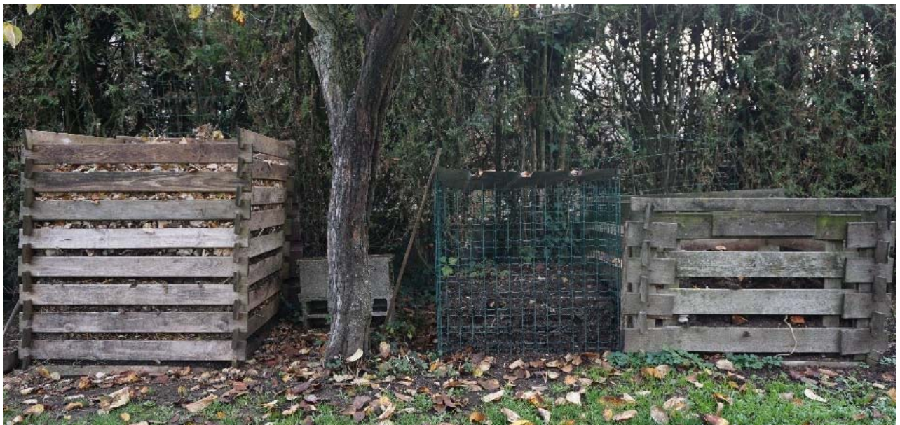
E1 : 3 bacs à compost placés au fond du jardin de façon visible.

Le compostage constitue la première forme de valorisation de ces déchets. Il permet de récupérer la plupart des déchets organiques en valorisant le résultat de leur putréfaction. L'engrais produit est utilisé pour renouveler et enrichir les sols ou directement en vaporisant le liquide recueilli sur des plantes. Que ce soit en logement individuel ou collectif, le bac à compost est placé à l'écart des lieux de vie (au fond du jardin, sur un balcon ou une loggia, voire il est caché et hors de portée du regard, lorsque la configuration de l'espace le permet) :