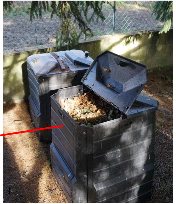
E4 : Bacs à compost cachés dans le jardin derrière de grands sapins